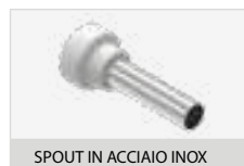
SPOUT IN ACCIAIO INOX