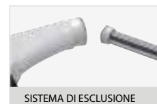
SISTEMA DI ESCLUSIONE